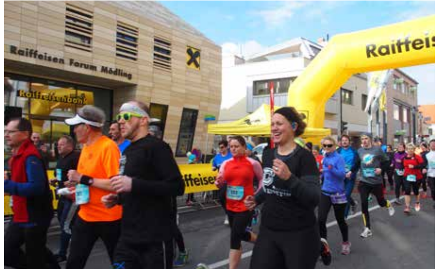
Ein Muss für alle Sportbegeisterten - der Raiffeisen-Osterlauf!