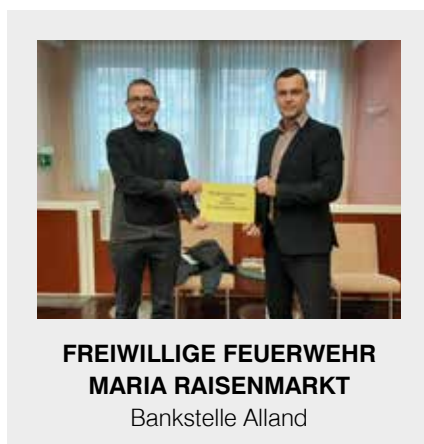
FREIWILLIGE FEUERWEHR MARIA RAISENMARKT Bankstelle Alland