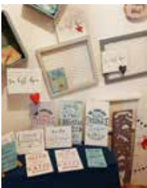
Selbstgemachtes aus dem Laden 31

PSYCHOSOZIALES GESUNDHEITSZENTRUM PSGZ-Mödling www.psgz.at www.laden31.at