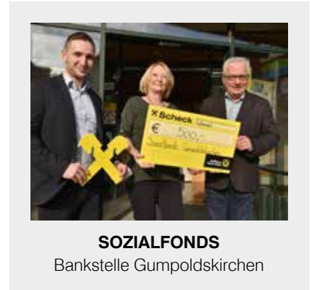
SOZIALFONDS Bankstelle Gumpoldskirchen