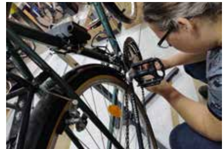
Beim Recyclen alter Fahrräder