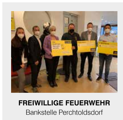
FREIWILLIGE FEUERWEHR Bankstelle Perchtoldsdorf