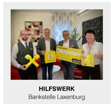
HILFSWERK Bankstelle Laxenburg