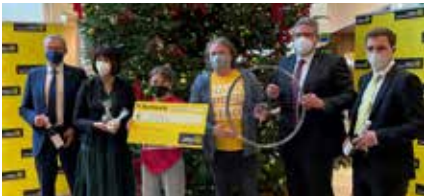
Freudige Spendenübergabe an Hand.Werk.Stadt

Auch zu Weihnachten 2021 spendeten wir wieder EUR 10.000,- zugunsten Organisationen in der Region, die dem Gemeinwohl dienen. Hinzu kam noch ein Förderpreis unseres Kooperationspartners „Teambank – der f@ire Credit“ in der Höhe von EUR 2.000,-.