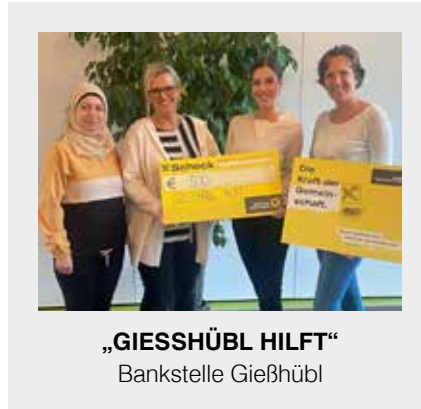
„GIESSHÜBL HILFT“ Bankstelle Gießhübl