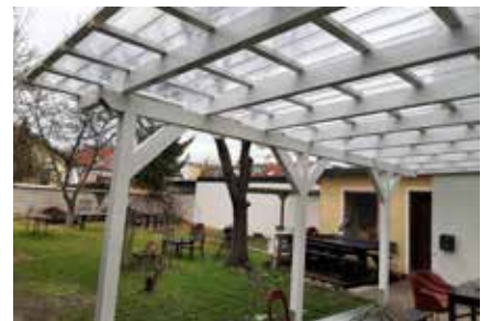
Der umgesetzte Outdoor-Werkplatz