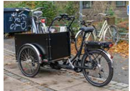
Ein typisches Lastenfahrrad

HAND.WERK.STADT DI-Wilhelm-Haßlinger-Straße 3 / Halle 6 A, 2340 Möding www.handwerkstadt.org