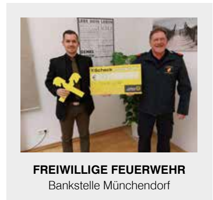
FREIWILLIGE FEUERWEHR Bankstelle Münchendorf