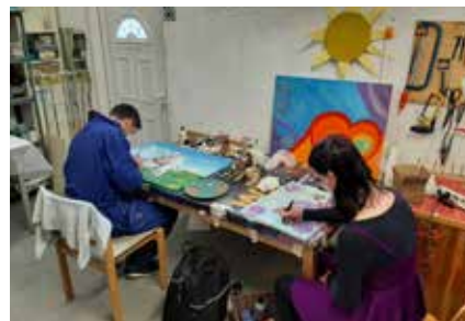
Klienten beim kreativen Arbeiten